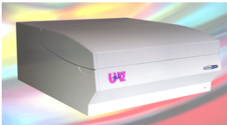
Spectrophotomètre SAFAS UVmc2